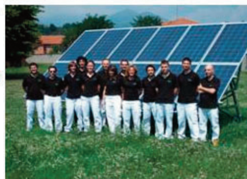
Il team della società V-Energy

consigliere delegato di V-Energy - che abbiamo formato da zero, dato che nessuna delle persone che lavora con noi aveva esperienze lavorative precedenti nel settore. I nostri collaboratori, con un'età media al di sotto dei 30 anni, hanno imparato un lavoro nuovo, anche attraverso corsi di formazione, motivazione e professionalizzazione finanziati dalla Regione Piemonte".